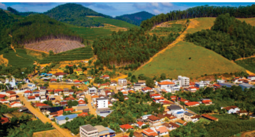
A programação será marcada por muita comida, com pratos preparados seguindo as receitas e costumes da tradição italiana, herança dos moradores locais