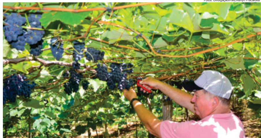
Os parreirais da região também serão abertos para degustação e venda da fruta