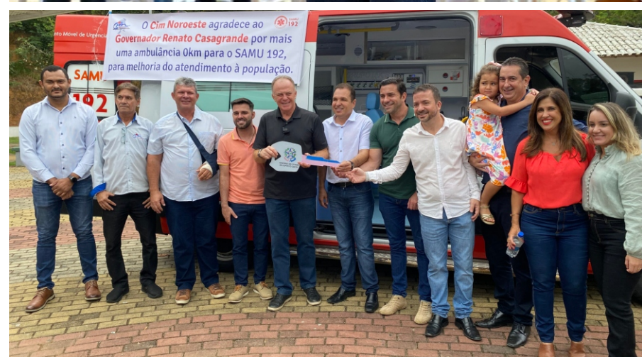
O Cim Noroeste agradece ao Governador Renato Casagrande por mais uma ambulância 0km para o SAMU 192, para melhoria do atendimento à população.