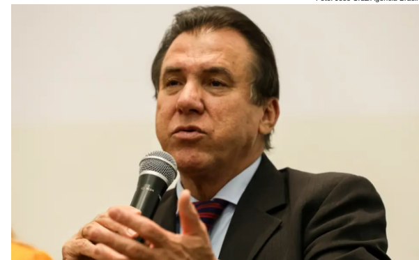
Ministro do Trabalho e Emprego, Luiz Marinho

Dados divulgados pelo MTE em 2023 revelam que, em 2022, o número total de acidentes de trabalho no Brasil foi de 612,9 mil, o que resulta na média de 69 acidentes por hora ou 1,15 acidente por minuto. No ano passa-